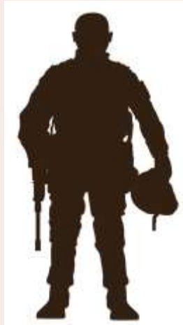
Командир військової частини